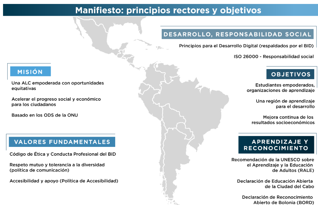
Figura 2: “Manifiesto BID”: Principios Rectores y Objetivos