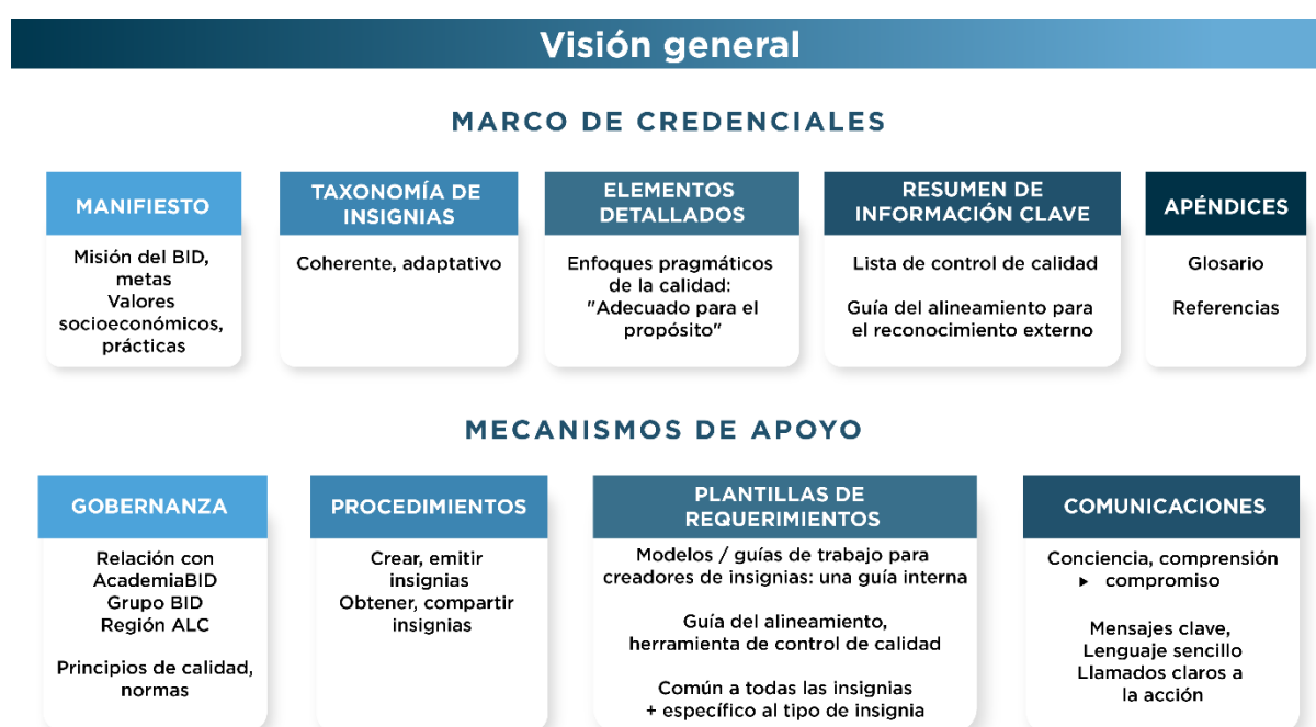
Figura 1: Descripción general del Marco de Credenciales Digitales del BID

El Marco de Credenciales es la autoridad central para la creación y emisión de credenciales en el ecosistema de credenciales digitales del BID. Es un documento vivo que evolucionará con el tiempo en función de las necesidades y oportunidades y será actualizado por CredencialesBID.