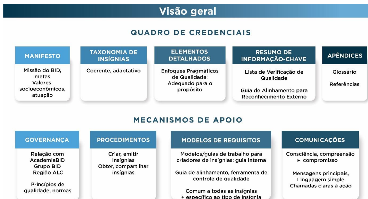
Figura 1: Descrição Geral do Quadro de Credenciais Digitais do BID

O Quadro de Credenciais é a autoridade central para a criação e emissão de credenciais no ecossistema de credenciais digitais do BID. É um documento em constante evolução que será atualizado por CredenciaisBID conforme as necessidades e oportunidades que se desenvolverem ao longo do tempo.