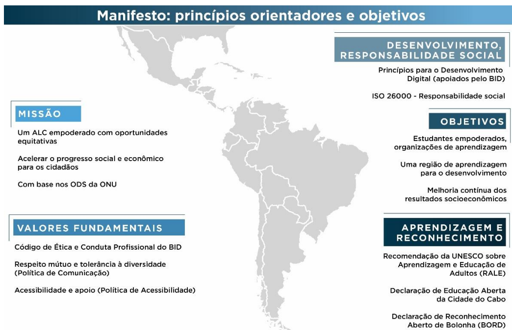
Figura 2: “Manifesto do BID”: Princípios Orientadores e Objetivos